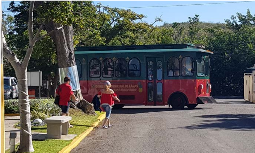
Trolley Municipio de Lajas