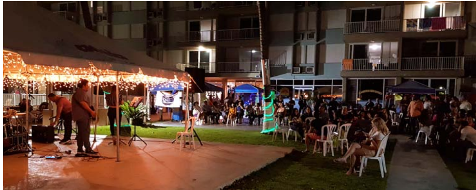
Banda de rock