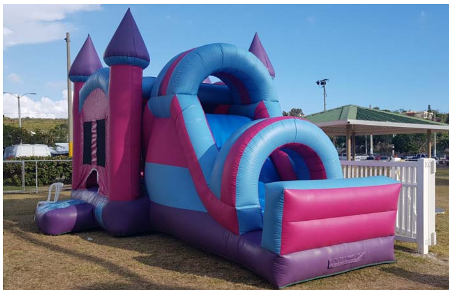
Casa de brincos