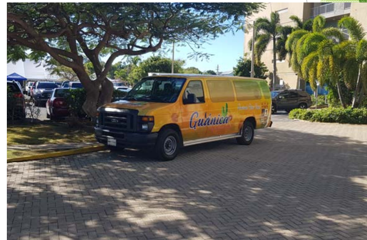
Trolley Municipio de Guánica