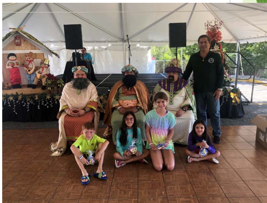
Entrega de dulces a niños