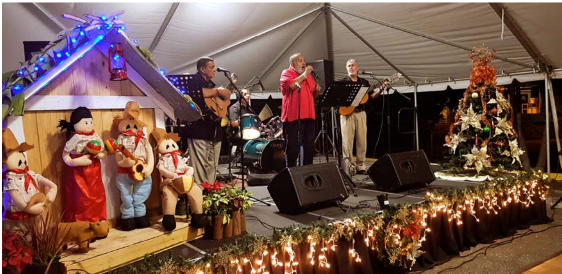
Actividad sábado en la noche