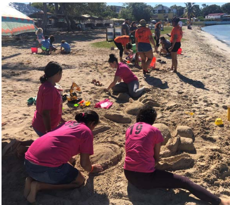
Competencia figuras de arena