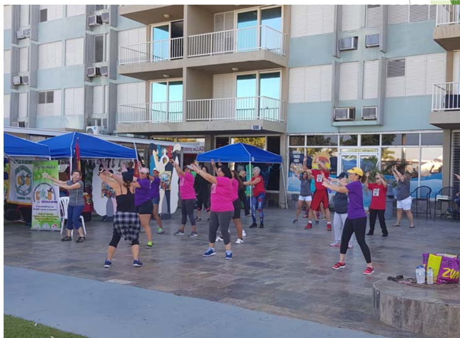
Clase de zumba